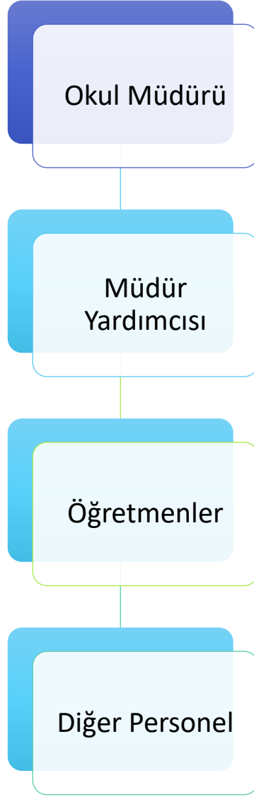
Grafik 2: Osman Manisalı İlkokulu Teşkilat Şeması